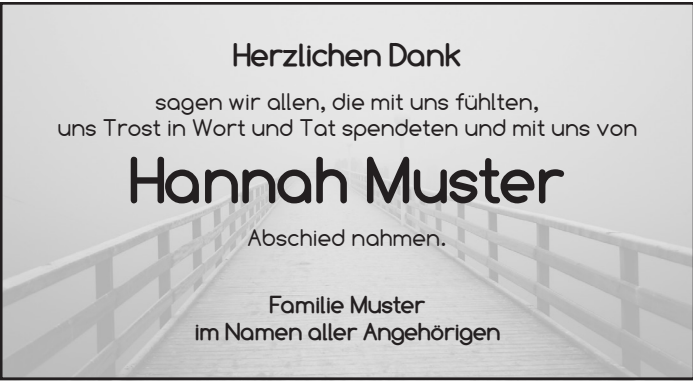
D24 Schrift: Comfortaa Bild: Steg 43709_A