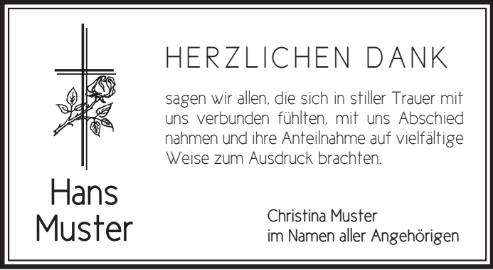
D23 Schrift: New Cicle Bild: Kreuz Rose | 300349 43708_A