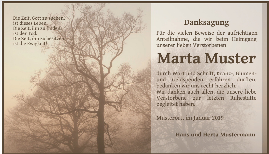
D09 Schrift: Gentium Book Basic