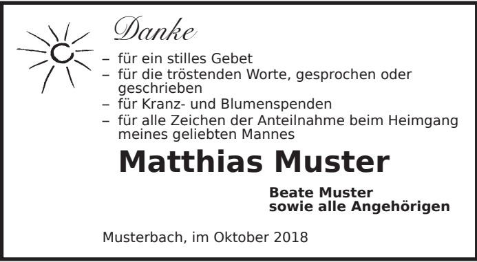
D25 Schrift: Bitstream Vera Sans Bild: Sonne_10 43710_A