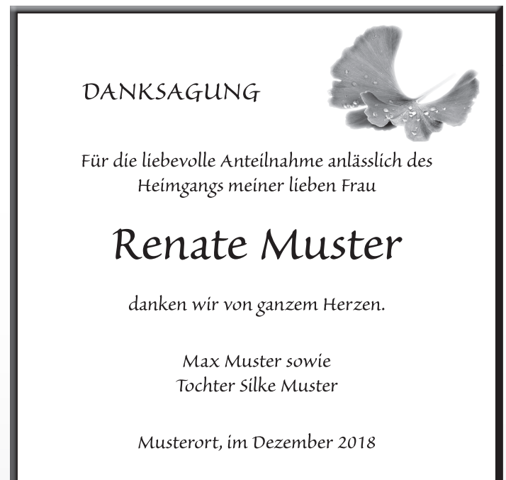
D20 Schrift: Sanvito Bild: Ginkgo_02_sw