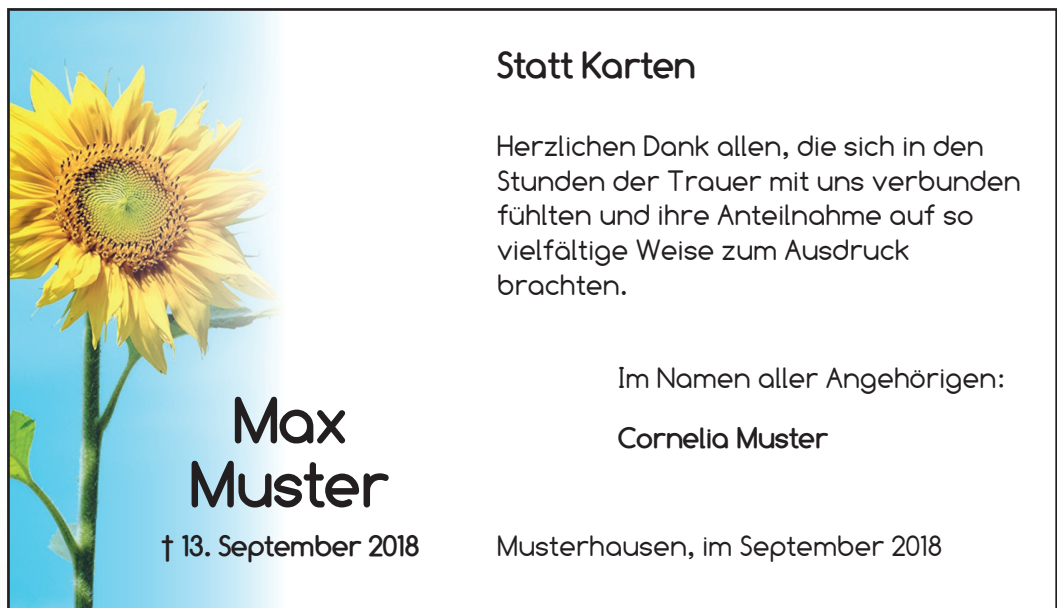
D10 Schrift: Comfortaa